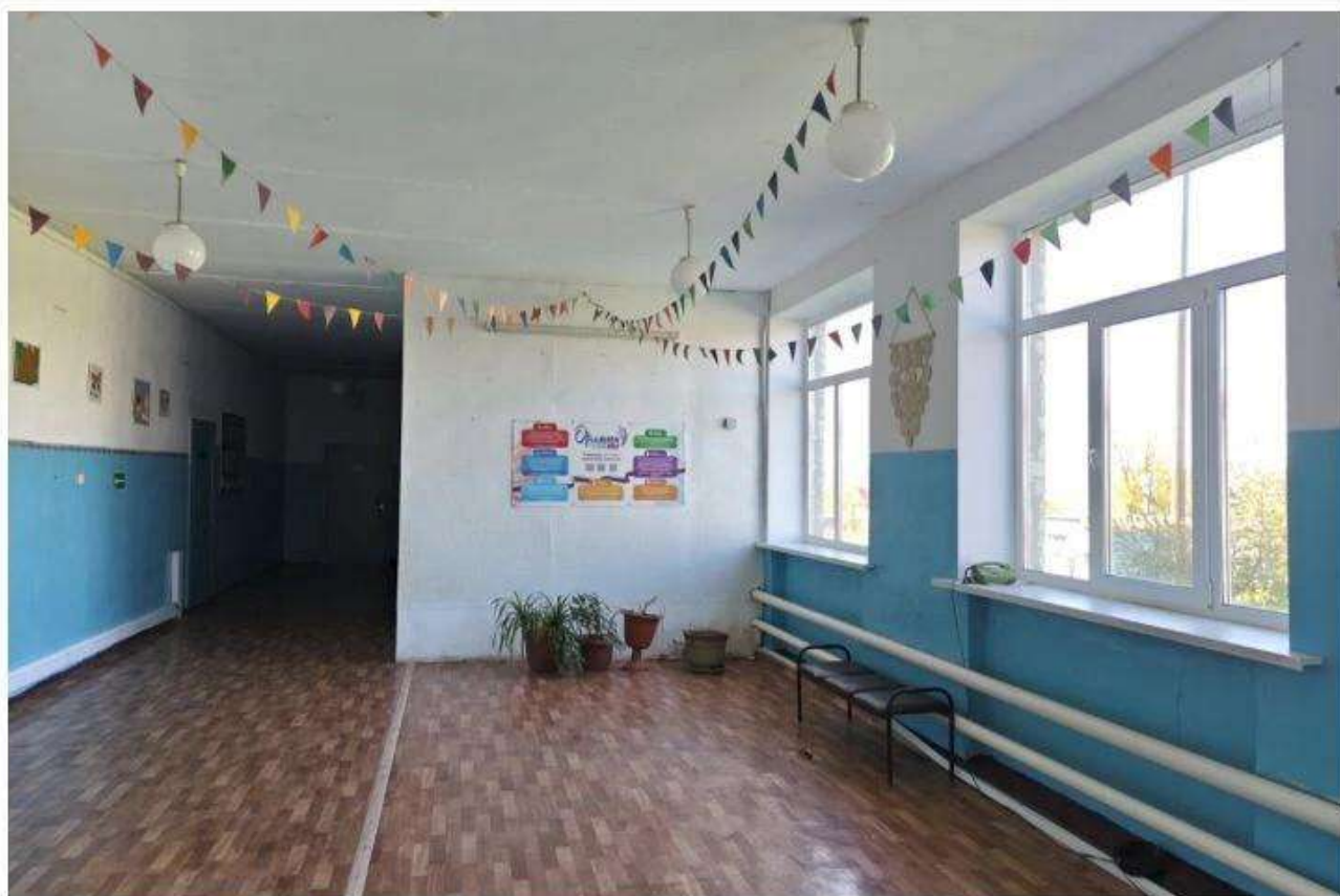
7.1 Фото «Стена Памяти» в школьном музее МБОУ Рябовской СШ» «ДО» начала реализации проекта (приложение 1)